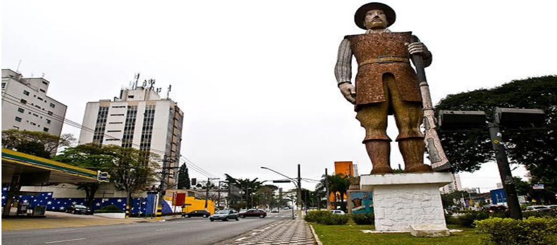
Imagem 4: Estátua do bandeirante Borba Gato inaugurada na década de 1960 na cidade de São Paulo, a sua posição foi colocada para que a frente indique o sertão e de costa para o mar, da onde viriam os colonizadores. A obra foi feita pelo escultor Júlio Guerra, a estátua possui peso de 40 toneladas e 10 metros de altura.

Nesse mesmo sentido, Eduardo Taddeo propõe um exercício de reflexão sobre o passado/presente, ao imaginar Zumbi dos Palmares caminhando nos dias atuais e vendo essas homenagens em ruas e avenidas com o nome dos seus algozes, 71 sobre isto ele diz: